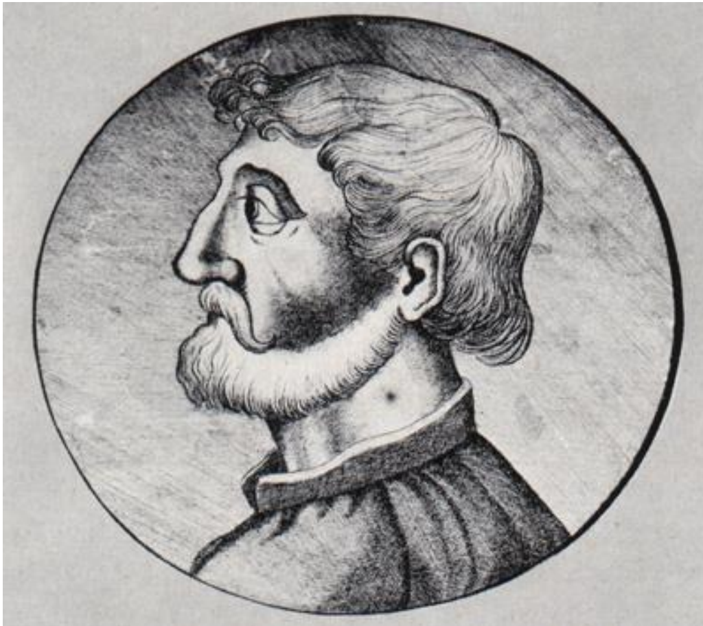
Portret van Marsilius van Inghen, getekend door een tijdgenoot.