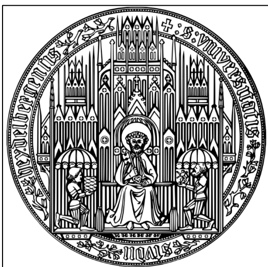
Logo van de universiteit van Heidelberg.

De algemene opvatting is de echter dat de universiteit in 1386 is gesticht. Marsilius wordt door Ruprecht tot eerste rector benoemd. Uit een oorkonde blijkt dat hij daarvoor een salaris ontvangt van twee honderd gulden per jaar. Negen achtereenvolgende termijnen is hij rector en heeft