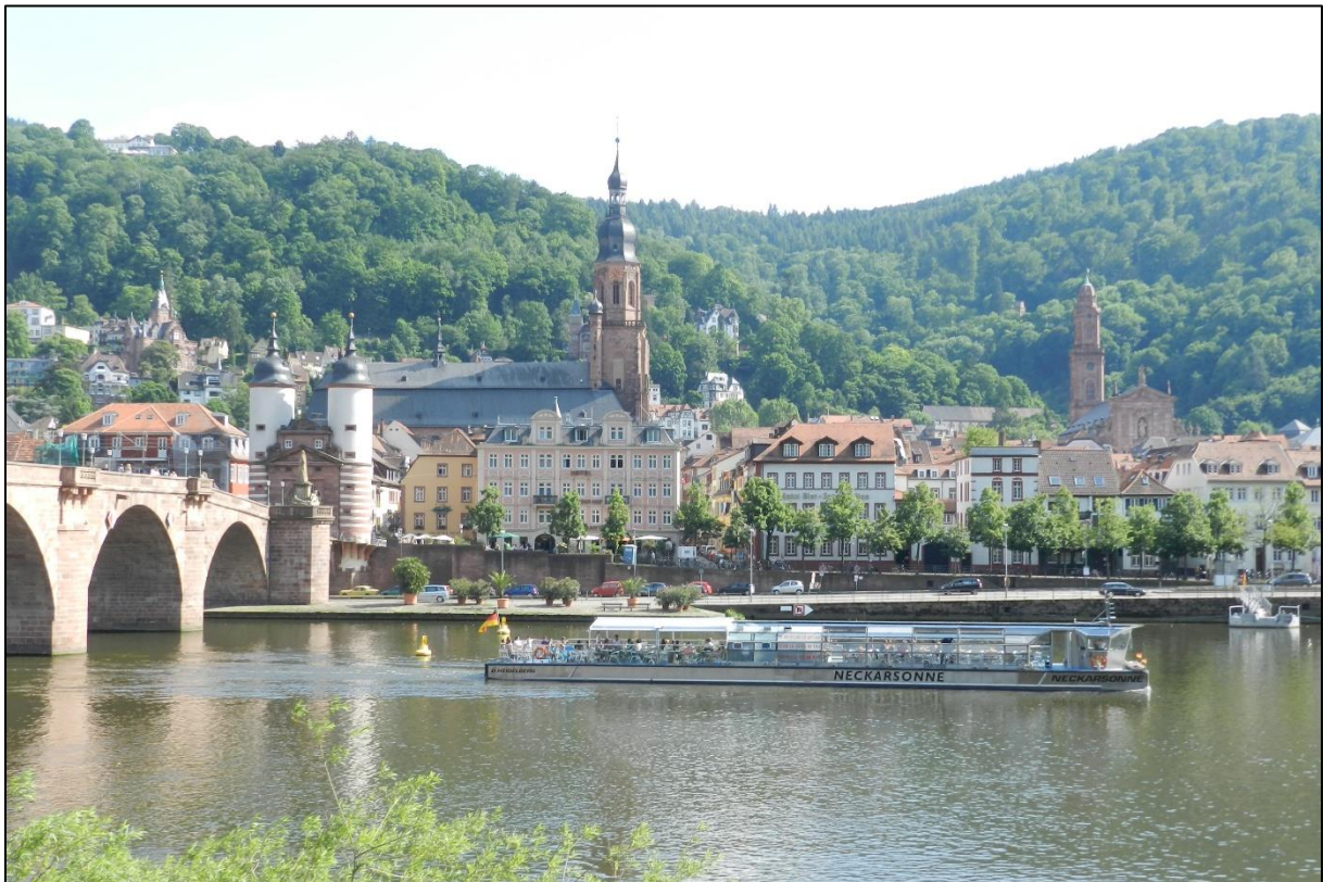
Gezicht op Heidelberg.