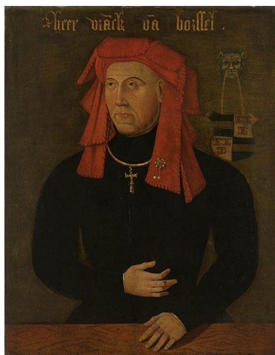
Portret van Frank van Borselen (overl. 1470).

Het bijzondere aan deze briefwisseling is dat het blijkbaar allemaal in het geheim moest gebeuren. Op een van de brieven staat bijvoorbeeld 'Incogniten aangaande der heerlijkheid van